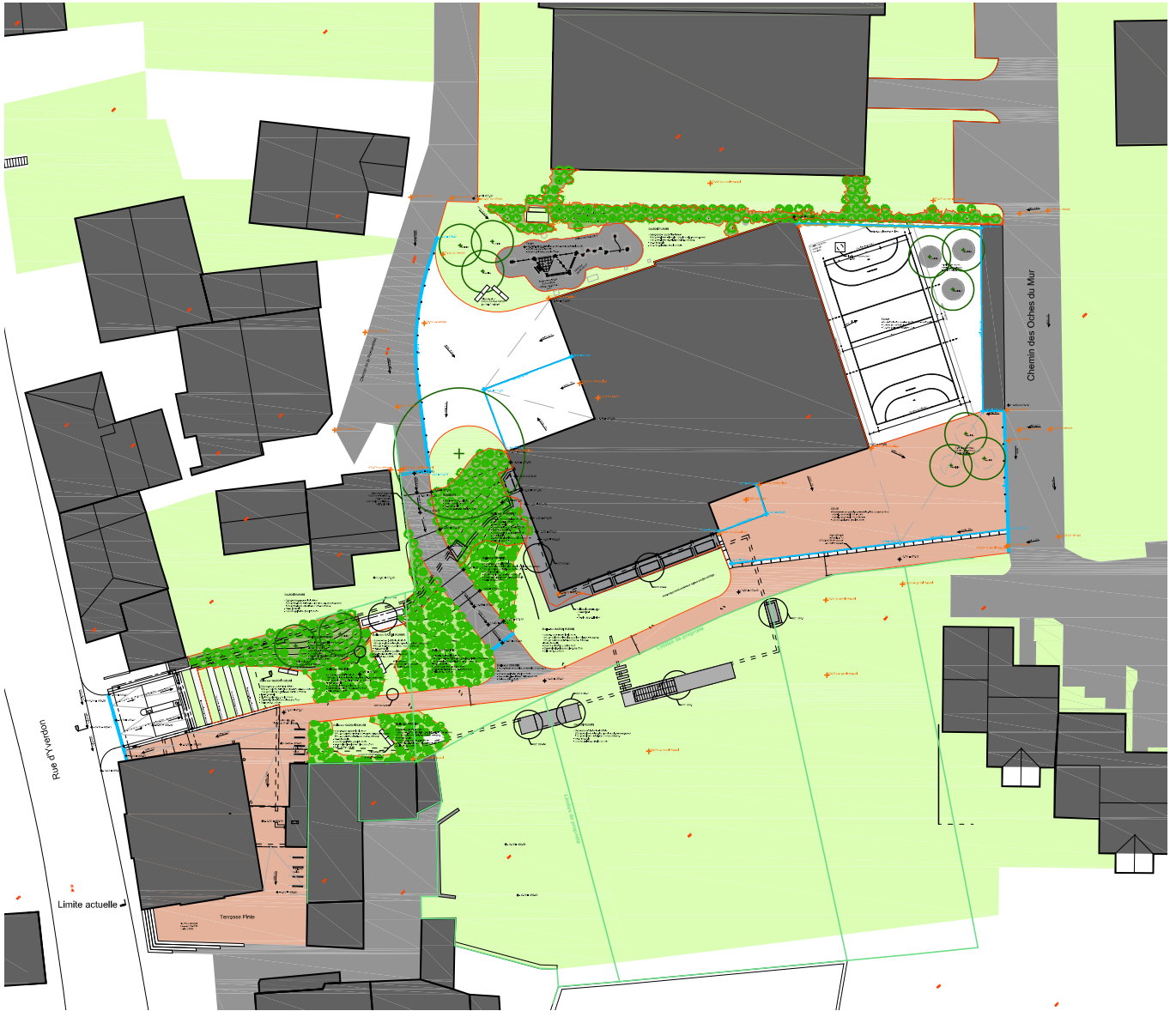
Plan aménagements extérieurs